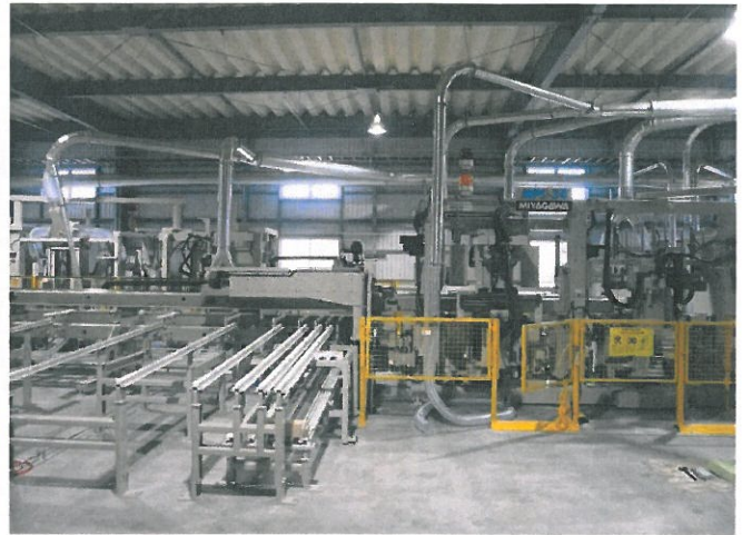
宮川工機 MPS-34 全自動柱材加工機