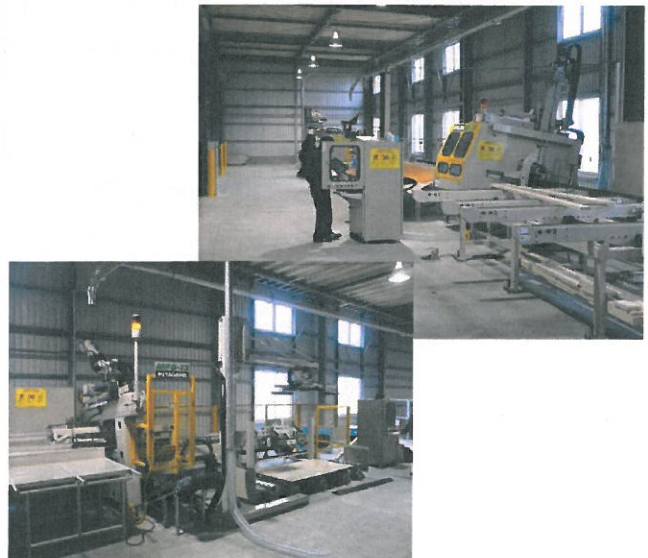
宮川工機 MPD-13 全自動サイディング合板加工機