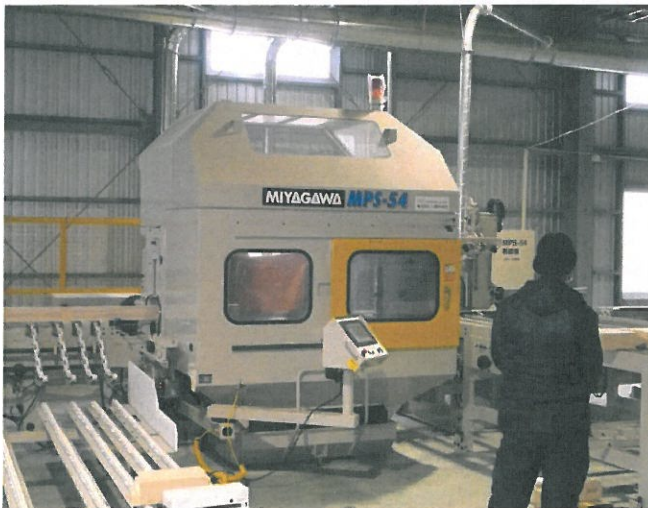
宮川工機 MPS-54 全自動多種加工機